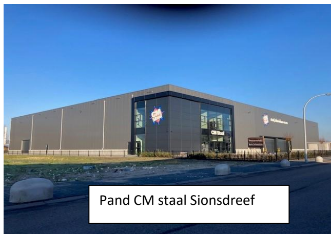
Pand CM staal Sionsdreef