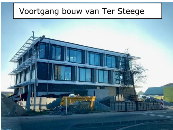
Voortgang bouw van Ter Steege