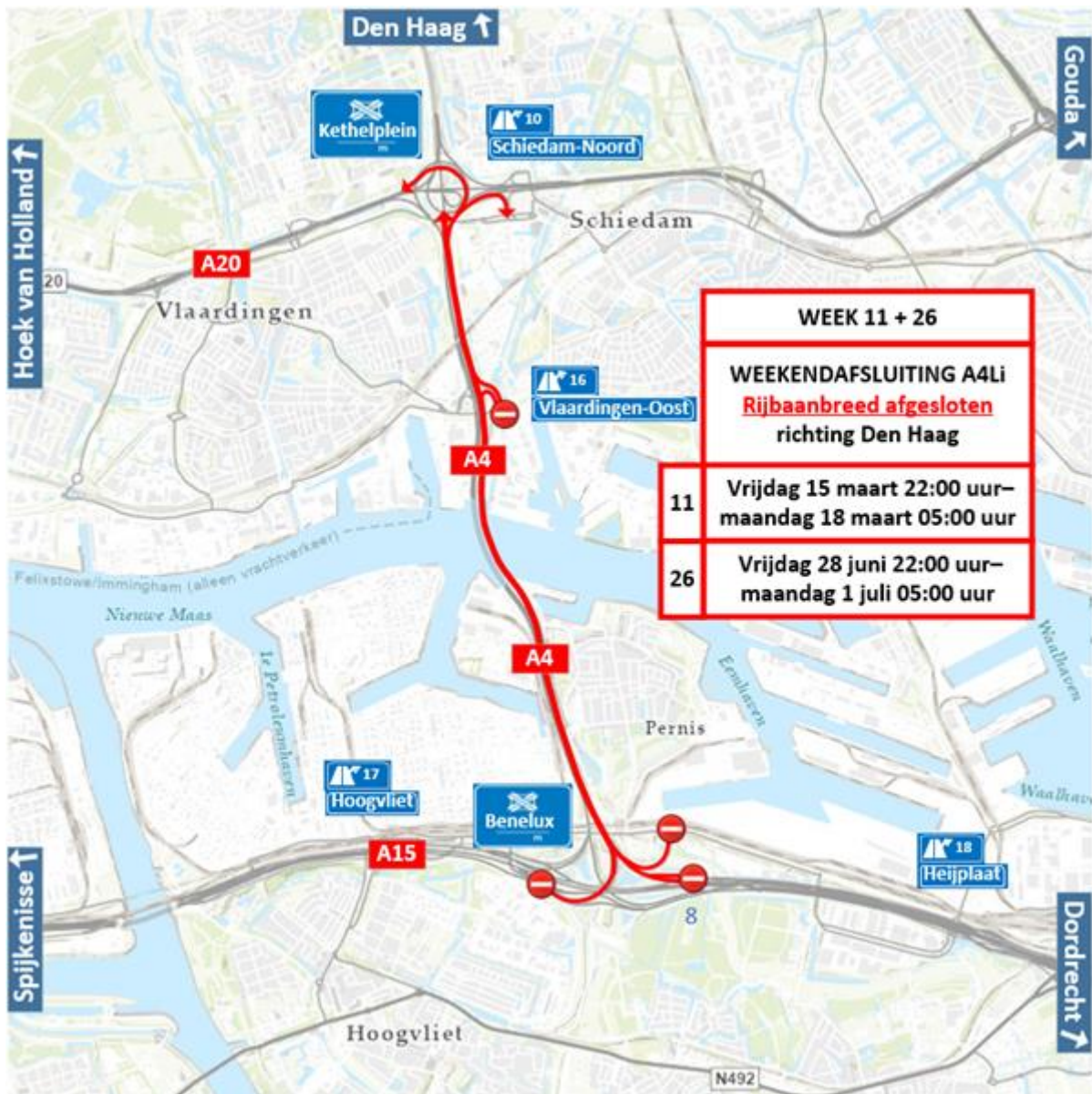
Figuur 1 Locatiewerkzaamheden op de A4Li knooppunt Benelux – knooppunt Kethelplein (Rotterdam-Zuid – Den Haag) week 11 en 26

In figuur 2 wordt de locatie van de afsluitingen in week 12 en 13 weergegeven.