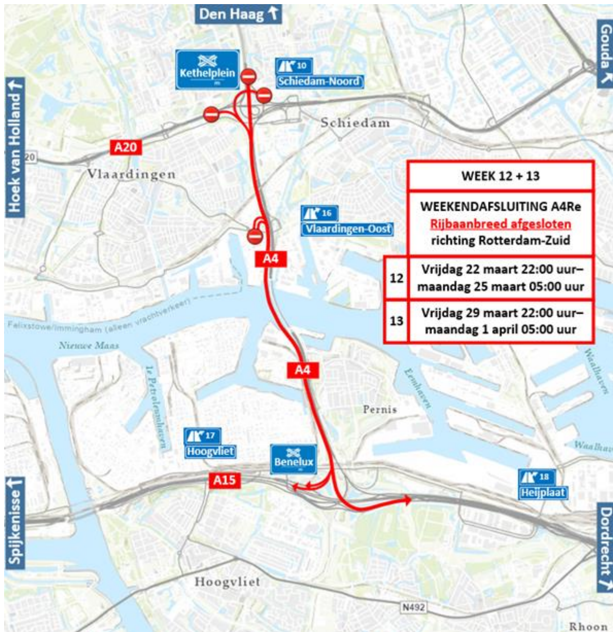
Figuur 2 Locatiewerkzaamheden op de A4Re knooppunt Kethelplein – knooppunt Benelux (Den Haag – Rotterdam-Zuid) week 12 en 13