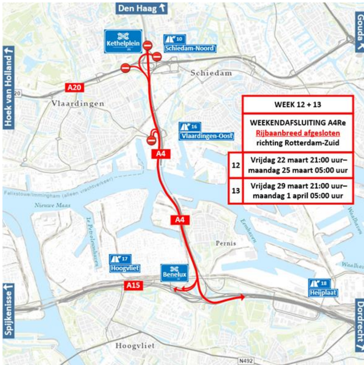
Figuur 2 Locatiewerkzaamheden op de A4Re knooppunt Kethelplein – knooppunt Benelux (Den Haag – Rotterdam-Zuid) week 12 en 13