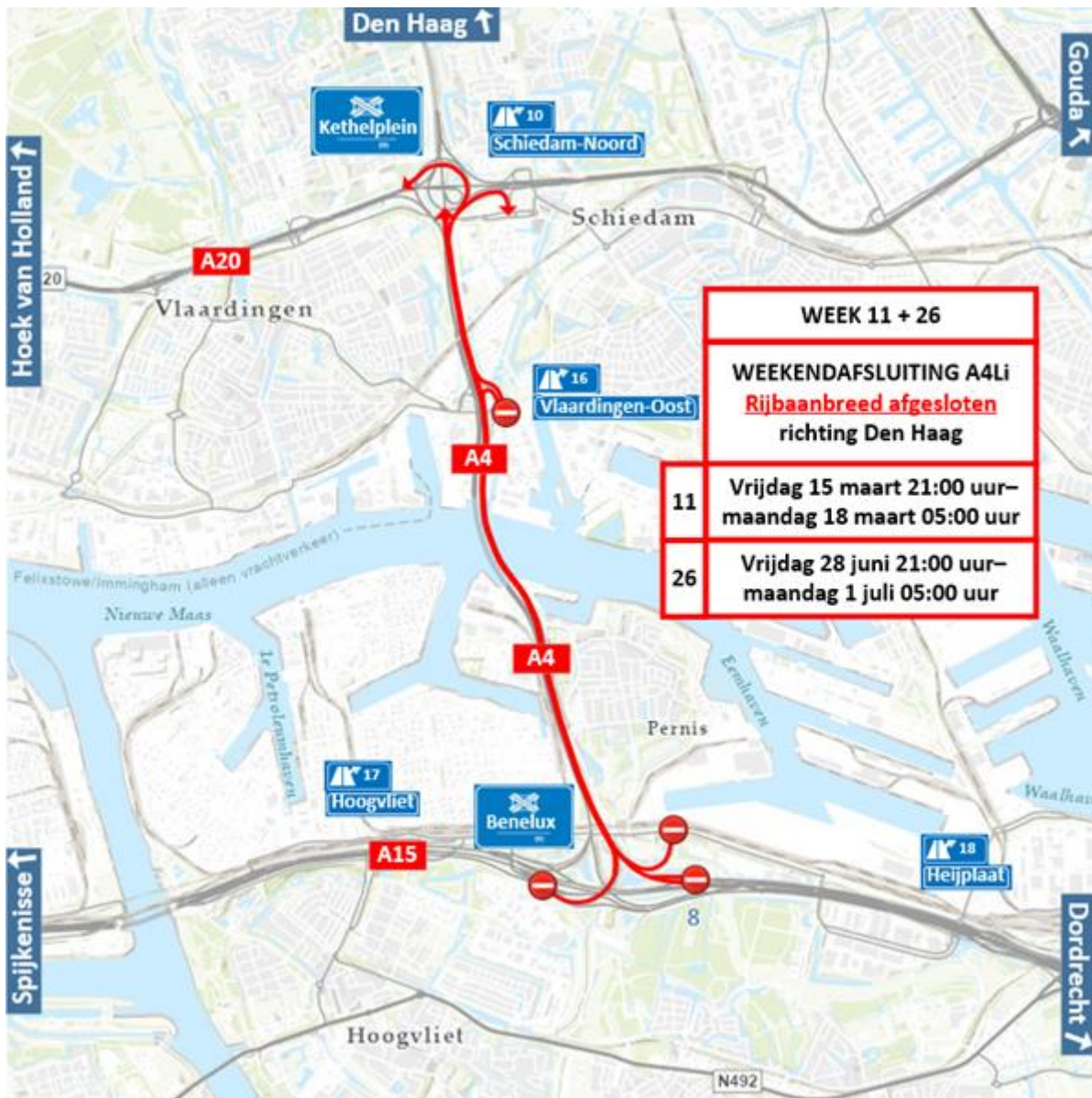
Figuur 1 Locatiewerkzaamheden op de A4Li knooppunt Benelux – knooppunt Kethelplein (Rotterdam-Zuid – Den Haag) week 11 en 26

In figuur 2 wordt de locatie van de afsluitingen in week 12 en 13 weergegeven.